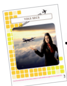
le bulletin Vols Secs*

pièces à joindre (*voir détail page 26 du Guide 2012) :