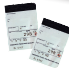
les coupons d'embarquement Aller-Retour originaux